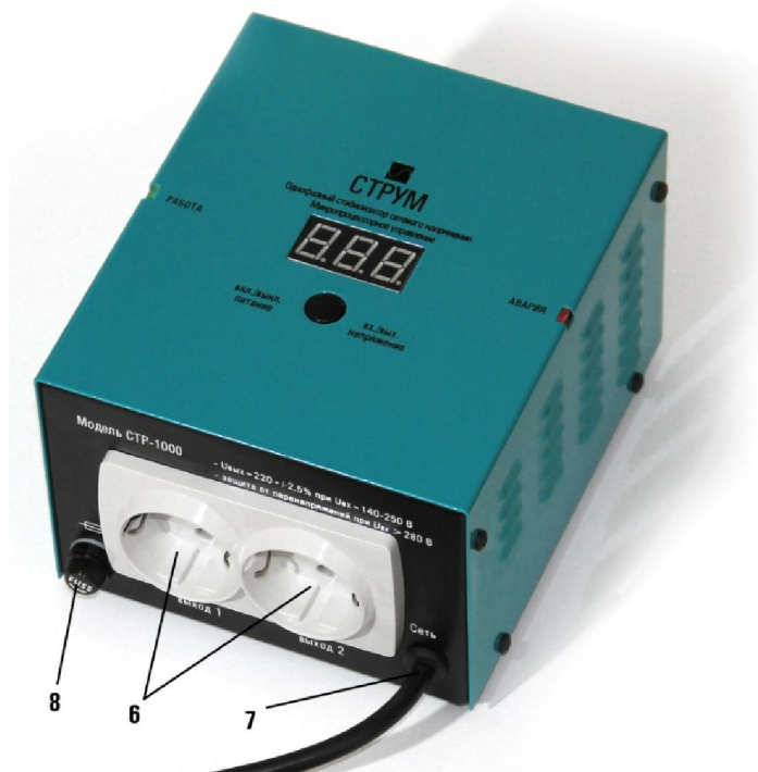
Рис.2 Задняя панель стабилизатора.