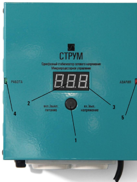
Рис.1 Лицевая панель стабилизатора напряжения

Стабилизатор (рис.1) выполнен в металлическом корпусе прямоугольной формы. Все функциональные узлы стабилизатора расположены на шасси, которое закрыто лицевой частью корпуса, задней частью корпуса, крышкой и дном.